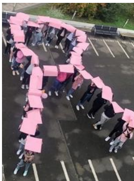
Moment de clôture du vendredi rose édition 2022 : Ruban rose géant des élèves du lycée Madeleine Vionnet