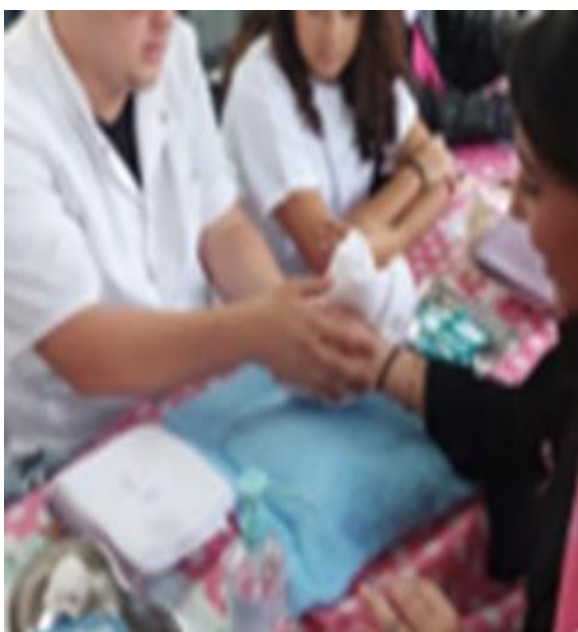
Atelier massage des mains